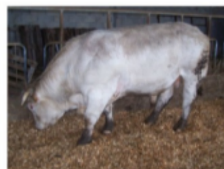
Taureau Charolais sur aire raclée les plaquettes absorbent les jus, couche antidérapante

Lundi 18 septembre – lieu à définir en fonction des inscriptions