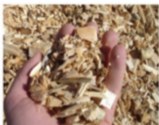
Plaquettes de petites tailles