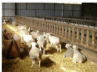
Brebis sur litière plaquettes litière sèche, pas de boiterie aucun problème pour la laine