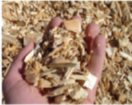
Plaquettes de petites tailles