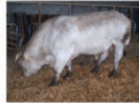
Taureau Charolais sur aire raclée les plaquettes absorbent les jus, couche antidérapante