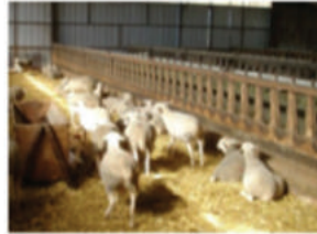
Brebis sur litière plaquettes litière sèche, pas de boiterie aucun problème pour la laine