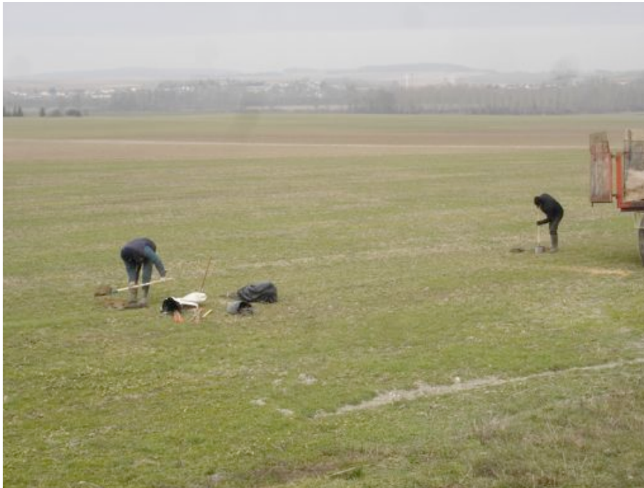
Plantation des noyers par les techniciens de la COFA (Brienne-sur-Aisne, mars 2013)

L'objectif est donc de valoriser à la fois une production agricole annuelle ou pluriannuelle et une production pérenne de bois d'œuvre, à haute valeur ajoutée comme le noyer.