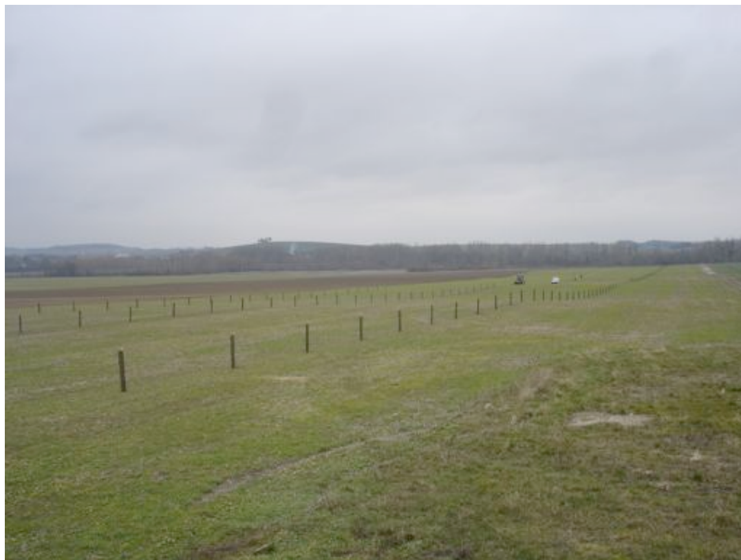
Lignes d'arbres intra parcellaires, projet agroforestier (Brienne-sur-Aisne, mars 2013)