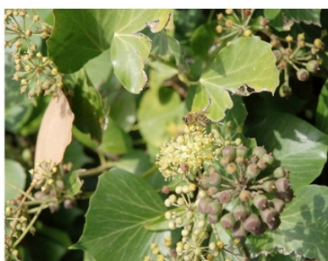
Après le lierre...

Pour en savoir plus sur l'Association Française d'AgroForesterie : http://www.agroforesterie.fr/